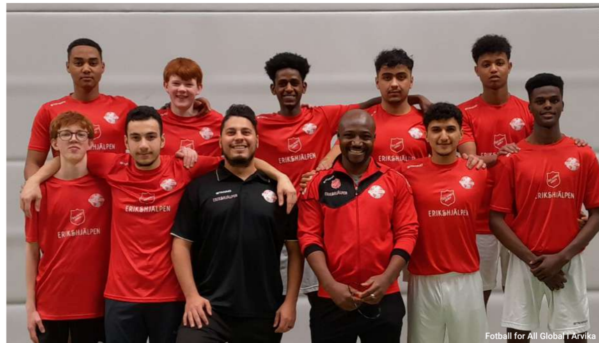
Fotboll for All Global i Arvika