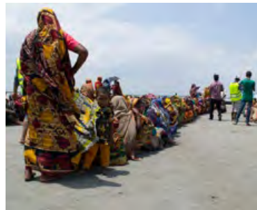
När behoven är stora blir köerna långa.

Se exempel på sid 16-17 i Erikshjälpens Årsberättelse 2018