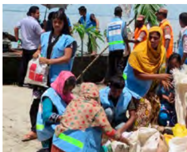
Utdelning av mat och hygienkit.

Erikshjälpen arbetar också med humanitära insatser . Under 2018 fokuserade dessa insatser främst på Östafrika och den svåra torkan i regionen, med projekt i Sydsudan och Kenya, där människor fått tillgång till vatten och mat. Erikshjälpen har under perioden också bidragit till humanitära insatser i Bangladesh, Mali och Indonesien. På samma sätt som med de långsiktiga utvecklingsprojekten arbetar Erikshjälpen i de humanitära insatserna framförallt med lokala partnerorganisationer.